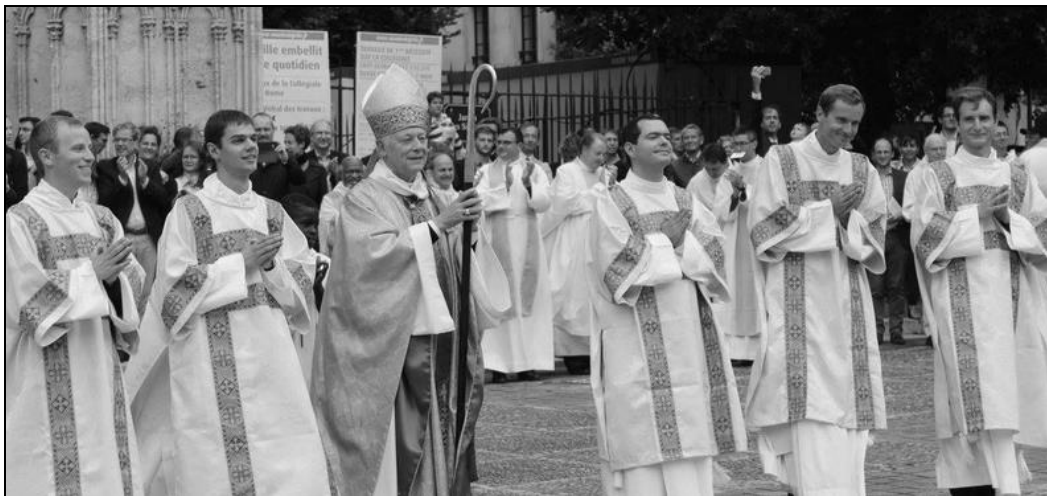
Les ordinations diaconales par Mgr Aumonier