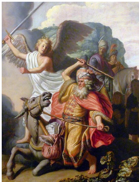
Le prophète Balaam par Rembrandt

L'attitude honnête de Balaam semble digne de louange. Pourtant, nous dit Newman, elle ne plaît pas au Seigneur. Le prophète, en effet, se contente d'obéir à Dieu pour apaiser sa conscience, pour être en conformité avec lui-même, pour ne pas déplaire au Seigneur. Son attitude n'est pas guidée par l'amour de Dieu et par le désir de Lui