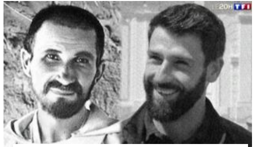
Saint Charles et Charle le miraculé

Ces Rencontres ont été organisées par l'école et le collège Saint-Charles de Foucauld qui ont voulu ainsi honorer et faire aimer davantage leur saint patron à l'occasion du premier anniversaire de sa canonisation (15 mai 2022 à Rome). L'objectif a été plus que largement atteint ! La figure lumineuse de saint Charles de Foucauld et ses dons