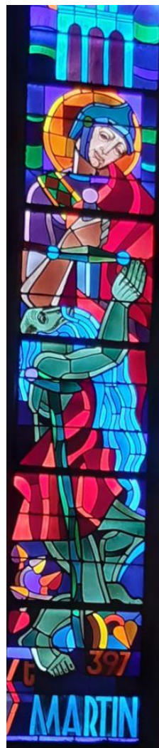
Saint Martin 11 novembre